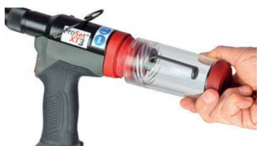
Rychlosnímatelná sběrná nádoba