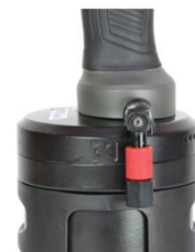
Úhlový vzduchový přípoj s přepínačem on/off