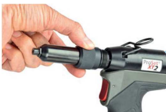
Rychlosnímatelná hubice a svěrací hlava (bez použití nářadí)